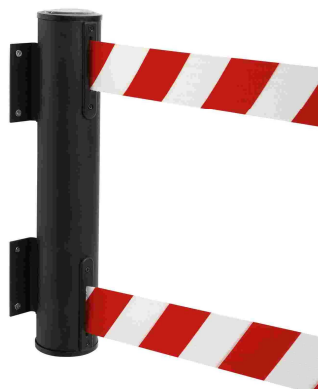
Art. GLWD 45-J-13-2,3mt