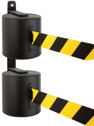
Art. GLWD2000-J/17-20 mt