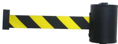
Montaggio a parete con vite 1- Art. GLW 1000-J/17

Flessibile nell'allineamento e nella lunghezza di estensione