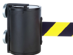
Montaggio a parete con magnetico 2- Art. GLWM 1000-17