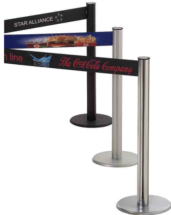
Art. GLA 75