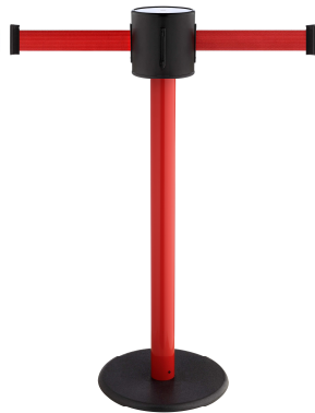
Art. GLAD 28-D/01