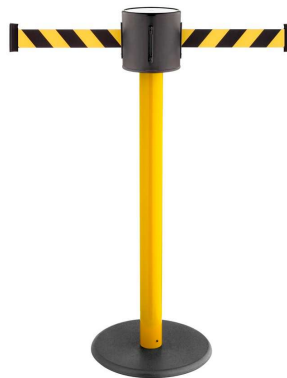
Art. GLAD 28-E/17